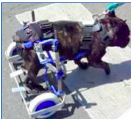
LASCAR, Bouledogue français, Hernie discale aiguë, paralysie grade 5

Lascar a bénéficié d'une opération de décompression chirurgicale. Le pronostic est réservé