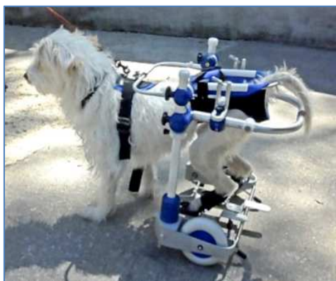
ATTILA, Croisé Bichon Accident de voiture, paralysie quasi totale

Attila a été opéré de son traumatisme vertébral. Peu d'espoir de remarcher